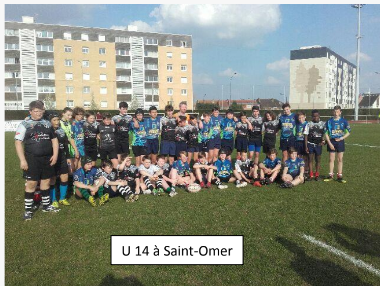
U 14 à Saint-Omer