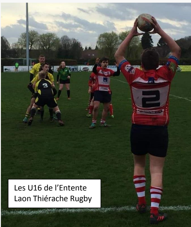
Les U16 de l'Entente Laon Thiérache Rugby

Un weekend de record !! Les 9 et 10 mars nos équipes ont toutes été victorieuses et chose rare le seuil des 100 points a été atteint 2 fois en trois rencontres! Ce sont les U16 qui ont ouvert ce weekend avec une victoire 100 à 5 face à Cambrai, les U19 ont maîtrisés les mêmes adversaires sur le score de 38 à 21. Le dimanche ce sont les seniors qui ont enregistré la plus grosse victoire de l'histoire du club en s'imposant 124 à 12 face à Boulogne sur Mer. Ces derniers étant en effectif incomplet le match s'est joué à 11 contre 11 et officiellement la victoire n'est que de 25 à 0.