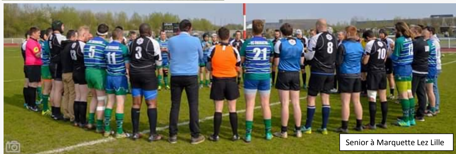
Senior à Marquette Lez Lille