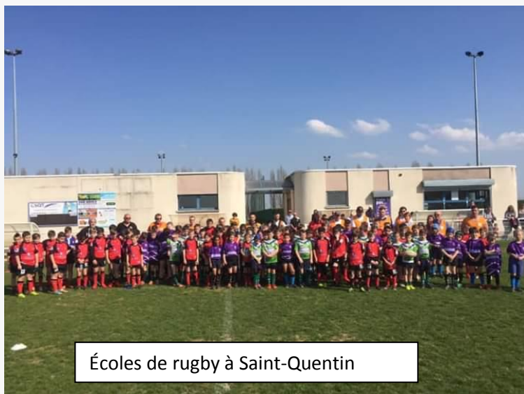
Écoles de rugby à Saint-Quentin